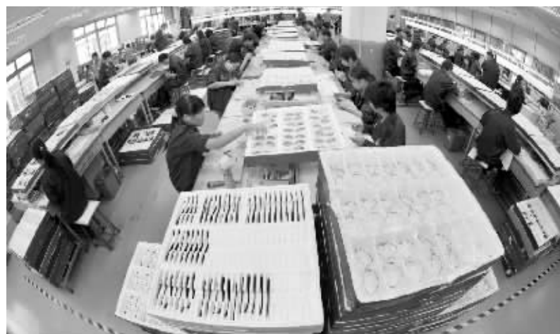
东莞设立10亿元专项资金,鼓励和资助加工贸易企业转型升级